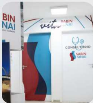
ESPAÇO VITA ALBERT SABIN