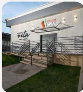
ESPAÇO VITA PARK NORTE